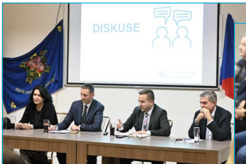
Diskuze v Kunčičkách.

Na podzim se konalo během měsíců října a listopadu celkem pět veřejných setkání, a to dříve také v Heřmanicích a Koblově.