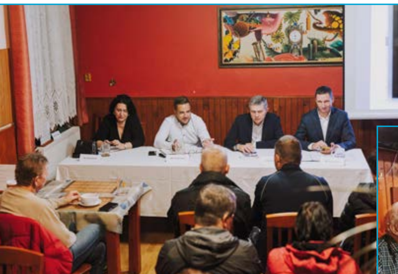
Setkání v Kunčicích.