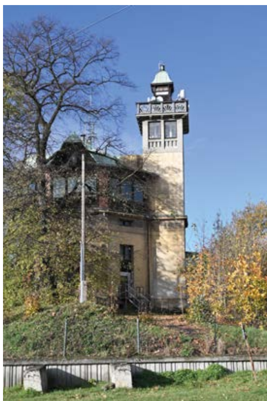
Vodárna. Současný stav.