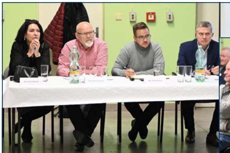
Lidé na setkání v Antošovicích.