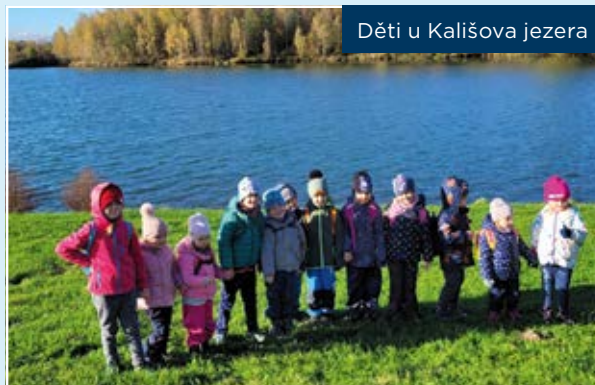
Děti u Kališova jezera